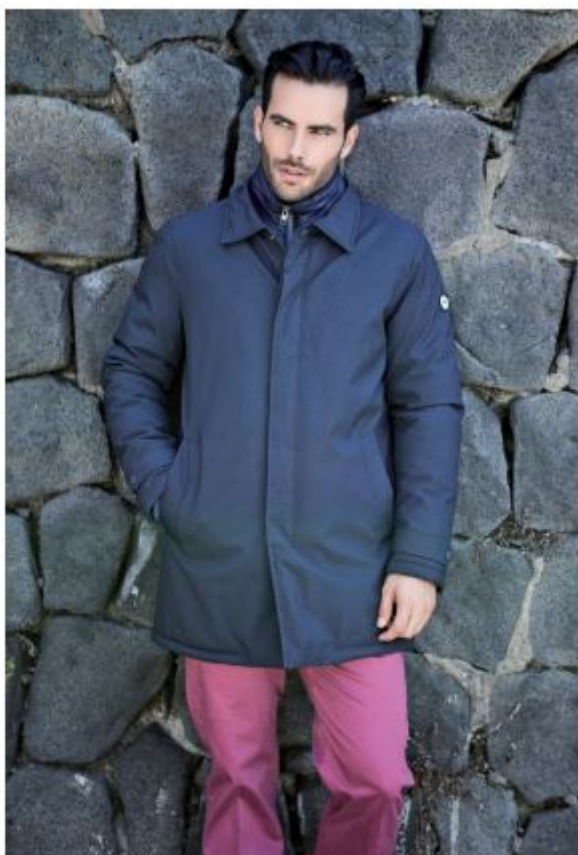
Armata di Mare

Brand storico che incarna la scelta maschile, porta tra le scelte una versatilità più comoda, serica però perdere il suo background. Oltre al blu scuro, inoltre, sempre presente e dominante in ogni stagione, toni di antracite, tortora e nero vengono ravvivati, nella maglieria, da punti di ottario, smeraldo, bordeaux e rosso. I cappella sono il cavallo di battaglia della collezione invernale. Alla serie storica per Armata di Mare in memory lace, si aggiunge una serie in poliestere con fodere fantasia e collo in pelo staccabile.