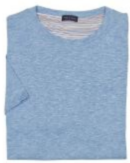
T-shirt in maglia collezione Primavera - Estate 2017 Paul&Shark

blazer dal taglio sartoriale, leggero e sfoderato, perfetto tanto per l'ufficio quanto per il tempo libero. Addio formalità ergo è bene dimenticarsi della camicia prediligendo, piuttosto, la t-shirt in maglia.