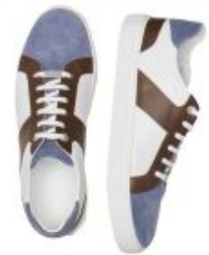
Sneakers in pelle scamosciata Paul&Shark, collezione Primavera - Estate 2017

Chi l'ha detto poi che il pantalone deve rigorosamente essere dello stesso colore della giacca? Il completo spezzato è sicuramente vincente. Puntare sui colori a contrasto è una scelta di stile che premia.